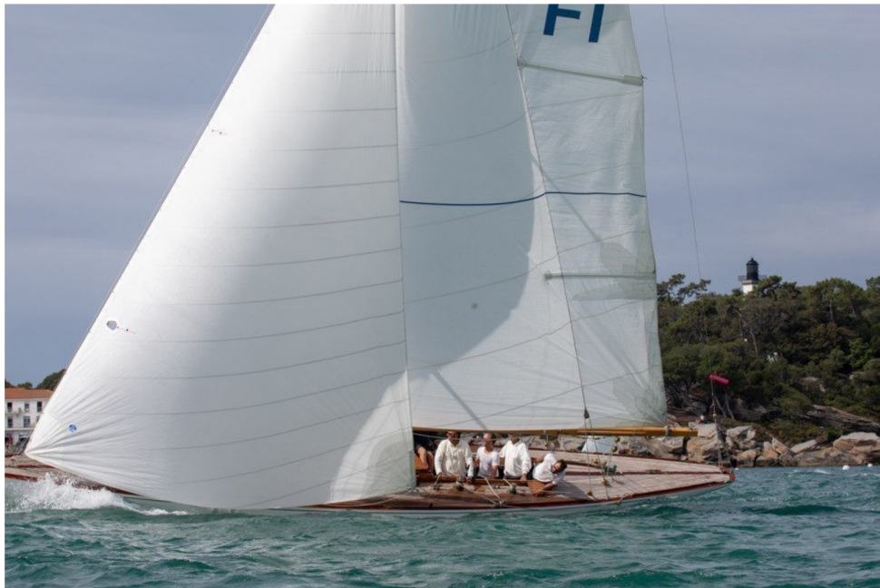
Aile VI lors sa participation à la Noirmoutier Classic

Le bateau Aile VI mis à l'eau en 1928 fait l'objet d'une restauration au chantier des ileaux, à Noirmoutier en l'île.